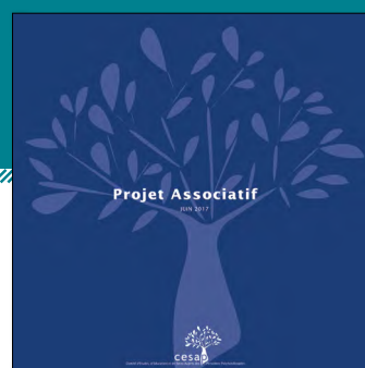
NOUVEAU PROJET ASSOCIATIF Juin 2017